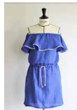
Robe/ top Kahlo