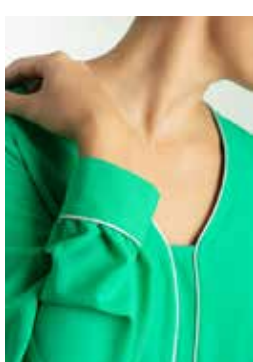
Robe/ top Magritte