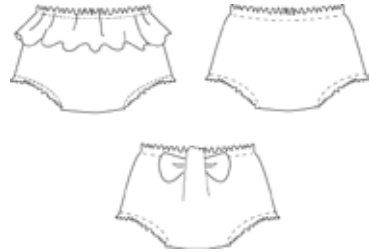
le trio de bloomer - du 3 au 18 mois