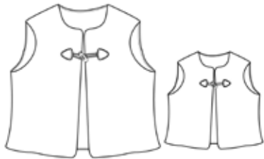
Veste Goya- inclut : - les tailles enfants (2 au 14ans) - et femme du 34 au 46